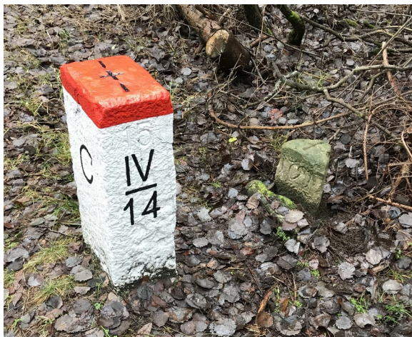
Ilustracja 65: Kamień z 1751 roku w sąsiedztwie współczesnego kamienia „IV/14”. Fotografia: Marian Gabrowski, listopad 2019.

Wydaje się więc, że opisywany tu kamień graniczny został ustawiony w 1751 roku przez administrację dóbr kowarskich, zakupionych zaledwie kilka lat wcześniej przez króla pruskiego. Widoczna po jarkowickiej stronie litera „H” najprawdopodobniej jest pierwszą literą ówczesnej nazwy tejże wioski, czyli „ Hermsdorf ”; być może pod spodem znajduje się liczba porządkowa „1”.