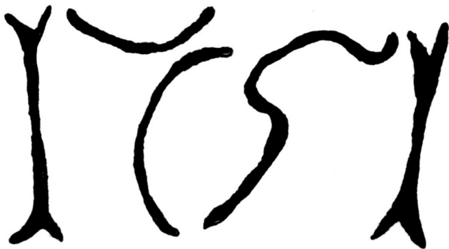
Ilustracja 64: Odrys konturów tworzących kształty, które najprawdopodobniej należy zinterpretować jako cyfry tworzące datę „1751”.

Kamień posiada trzy powierzchnie boczne, na których znajdują się nie tylko wykute napisy, ale także i oznaczenia naniesione ciemną farbą. Na stronie skierowanej ku Czechom, a więc miejscowości Horní Albeřice, wykute są najprawdopodobniej cyfry tworzące liczbę „1751”, będącą niewątpliwie datą ustawienia kamienia (patrz ilustracja 63, zdjęcie górne). Wprawdzie kształt owych cyfr jest dość specyficzny, jednakże z dużym prawdopodobieństwem można przyjąć, że jest właśnie liczba „1751” (patrz ilustracja 64).