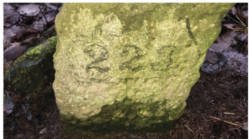
Ilustracja 63: Kamień graniczny ustawiony w dawnym trójstyku granic miejscowości Jarkowice, Nieda- mirów i Horní Albeřice. Fotografia: Marian Gabrowski, listopad 2019.